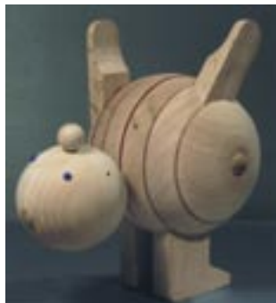
Uz odobrenje: Industrijski dizajn D2006009; Didaktička igračka; Nositelj i dizajner Dragutin Drago Turina

zaštitu za određene dizajne, primjerice dizajn tekstila ili materijala.