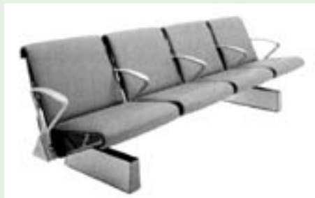
Uz odobrenje: TRAX

U nekoliko je navrata tvrtka inozemnim kompanijama izdala licenciju za proizvodnju ovoga sustava sjedala uz uvjet plaćanja odgovarajuće licenčne naknade.