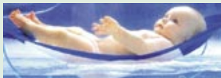
Uz odobrenje: BABY AND CHILDREN

Vodeći računa da se za vrijeme kupanja male bebe lijepo i udobno osjećaju, malo francusko poduzeće BABY AND CHILDREN dizajniralo je i proizvelo viseću mrežu za kupanje. Njezin je jednostavan i originalan dizajn postao privlačan majkama i bebama diljem svijeta. Kako bi osigurala zaštitu novoga proizvoda, tvrtka je predala međunarodnu prijavu za registraciju industrijskog dizajna u ožujku 2000. Nakon provedene registracije tvrtka je uspjela komercijalizirati proizvod, bilo izravno ili izdavanjem licencija na temelju registriranog industrijskoga dizajna, u više od deset zemalja na tri kontinenta. Proizvod je postigao značajan uspjeh. Danas je viseća mreža jedan od glavnih proizvoda tvrtke BABY AND CHILDREN , i ona ga uz pomoć monopola osiguranog zaštitom industrijskoga dizajna prodaje diljem svijeta.