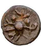
Čep amfore i crtež ulomaka oboda amfore s utisnutim žigovima izrađivane u rimskom naselju Sicum kraj Kaštela - 1 st.pr.Kr

Još od antičkog doba na ovim prostorima koristile su se u razmjeni dobara prepoznatljive radioničke oznake podrijetla proizvoda.