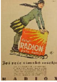
Promidžbeni plakat za deterdžent za pranje rublja "Radion" -časopis Svijet, Zagreb, 1929.g.