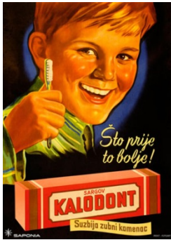
Promidžbeni plakat za pastu za zube tvrtke Saponia d.d., Osijek

Nakon drugog svjetskog rata i osnivanja nove države sa socijalističkim uređenjem u Federativnoj Narodnoj Republici Jugoslaviji područje žigova bilo je uređeno Zakonom o zaštiti industrijske svojine iz 1922. godine, s izmjenom 1928. godine, sve do donošenja Zakona o robnim i uslužnim žigovima 1961. godine.