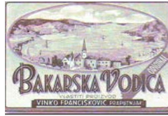
Etiketa s boce pjenušca „Bakarska Vodica“ približno 1930.g.

Nakon drugog svjetskog rata i osnivanja nove države sa socijalističkim uređenjem u Federativnoj Narodnoj Republici Jugoslaviji područje žigova bilo je uređeno Zakonom o zaštiti industrijske svojine iz 1922. godine, s izmjenom 1928. godine, sve do donošenja Zakona o robnim i uslužnim žigovima 1961. godine.